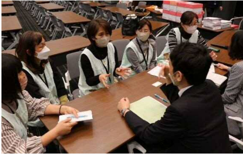
子ども家庭庁の職員と懇談する保育世話人の方たち